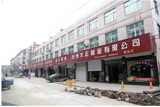
鞋业是村里的重要产业。