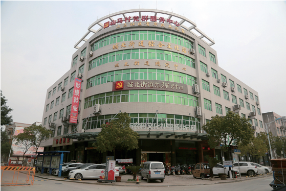
山马村村部，城北综合文化站等在内。