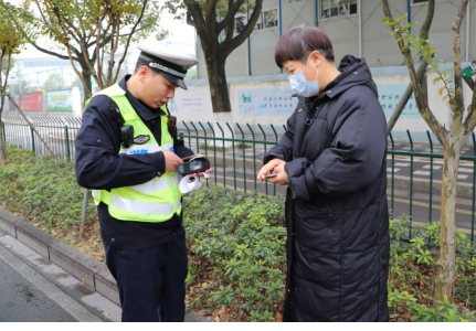
交警对横穿马路的向女士作出处罚。