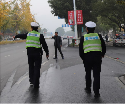
交警劝导一位欲横穿马路的市民打消念头。

民。我们知道不能这么走，交警也是为我们的安全着想，我们自己以后会注意的。大家都表示，横穿马路比过斑马线方便多了。 为贪图一时之便，他们抄近路跨越护栏，给自身及他人的生命安全带来隐患。我市交警部门表示，横穿马路、跨越护栏的行为已经涉及违法，不仅仅是大家意识中的一时之便，根据《中华人民共和国道路交通安全法》第六十三条规定：行人不得跨越、倚坐道路隔离设施，不得扒车、强行拦车或者实施妨碍道路交通安全的其他行为。第八十九条规定：行人、乘车人、非机动车驾驶人违反道路交通安全法律法规关于道路通行规定的，处警告或者五元以上五十元以下罚款；非机动车驾驶人拒绝接受罚款处罚的，可以扣留其非机动车。