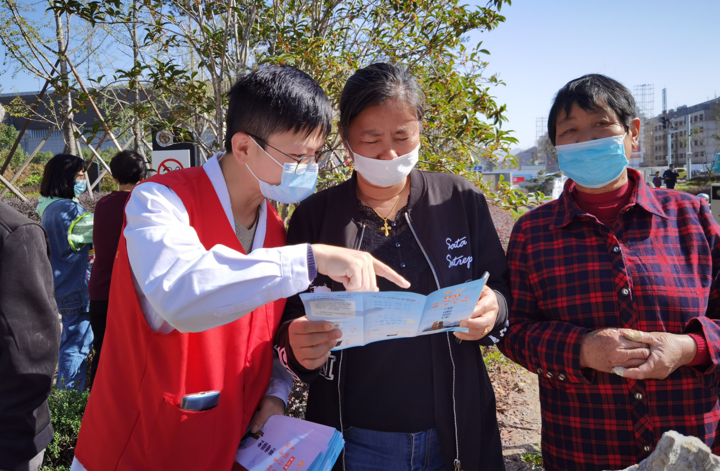
10月23日，市卫健局积极响应全市新时代文明实践之“文明同心 创城同行”集中志愿日行动号召，组织全系统各单位开展禁控烟、门前三包、《文明行为促进条例》宣传、垃圾分类、健康宣教义诊和环境清洁等活动。