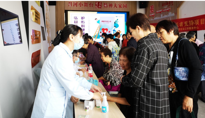
10月10日是“世界精神卫生日”。10月9日，市五院组织在太平河社区服务中心内设立咨询台，开展以“弘扬抗疫精神，护佑心理健康”为主题的义诊宣传活动。活动中，市五院、台州市第二人民医院多名专家开展现场心理咨询活动，免费为200余名群众测量血糖、血压，接受居民咨询100余人次，发放心理卫生等宣传资料200余份。