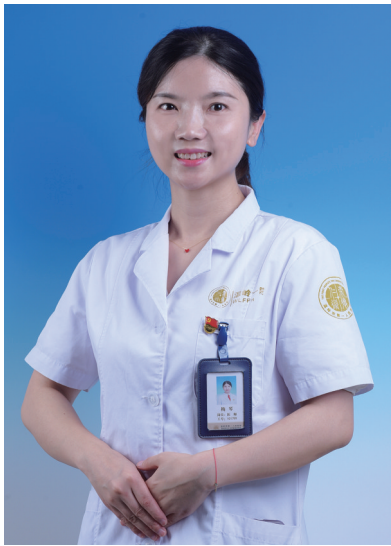
本报记者 朱丹君 实习生 林毅涵/文