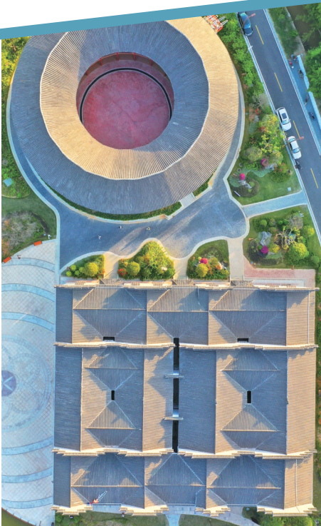
南康区家居特色小镇。