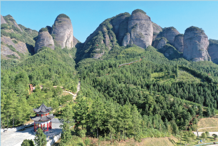
龙南县南武当山风景秀美。