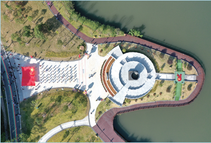
9月28日上午，近百名江西安远青少年与来自内地、香港等地的游客在东江源头安远县三百山上，共同挥舞国旗，同唱《我和我的祖国》。