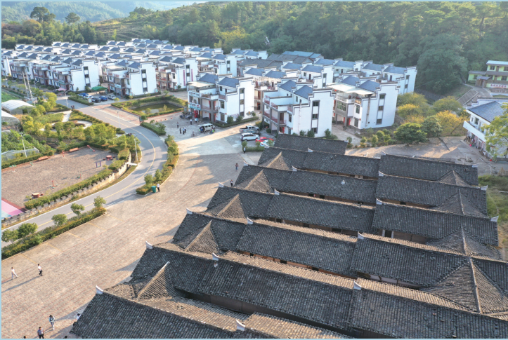
瑞金市黄沙村村民住进了小别墅。