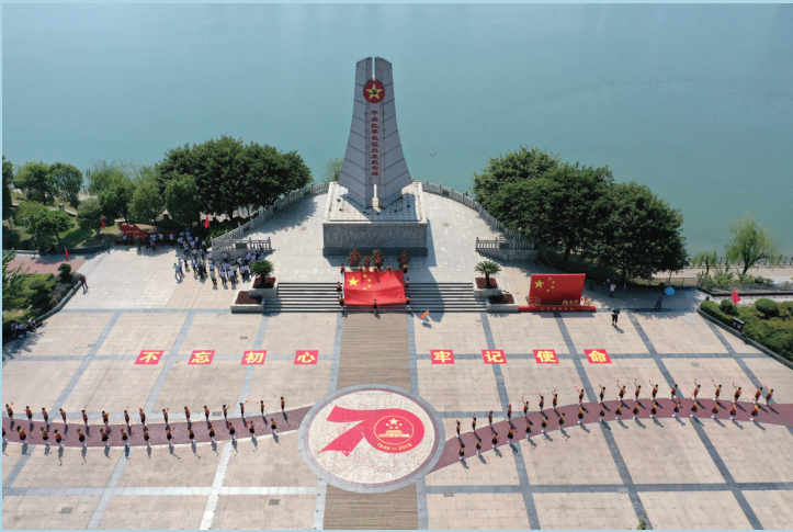
9月27日，来自江西省赣州市于都县长征源小学的70名小学生，站在于都县中央红军长征出发纪念广场上，挥舞国旗、高唱国歌。