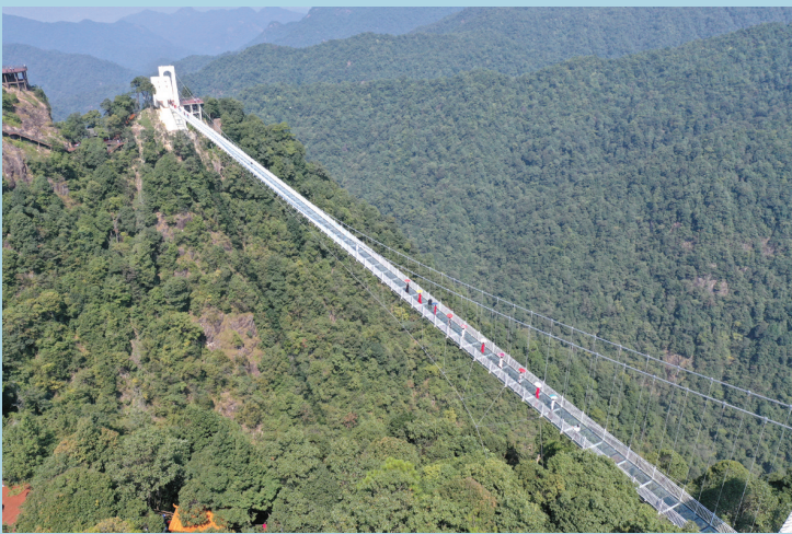
9月28日，赣州市安远县三百山景区350米长的玻璃索桥上演旗袍秀。