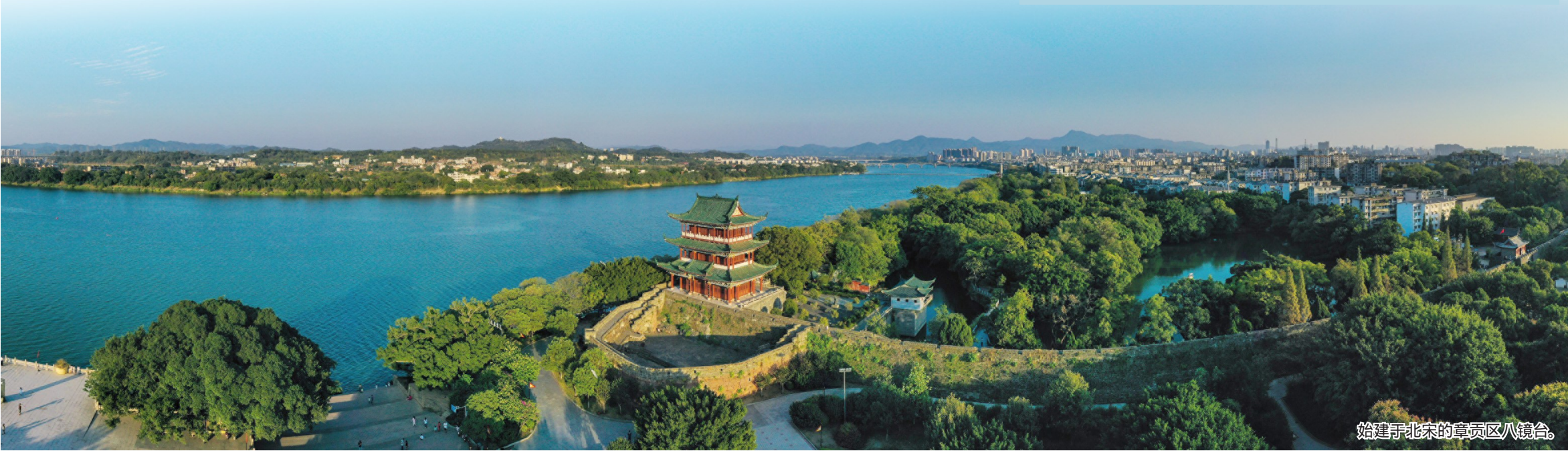
始建于北宋的章贡区八镜台。