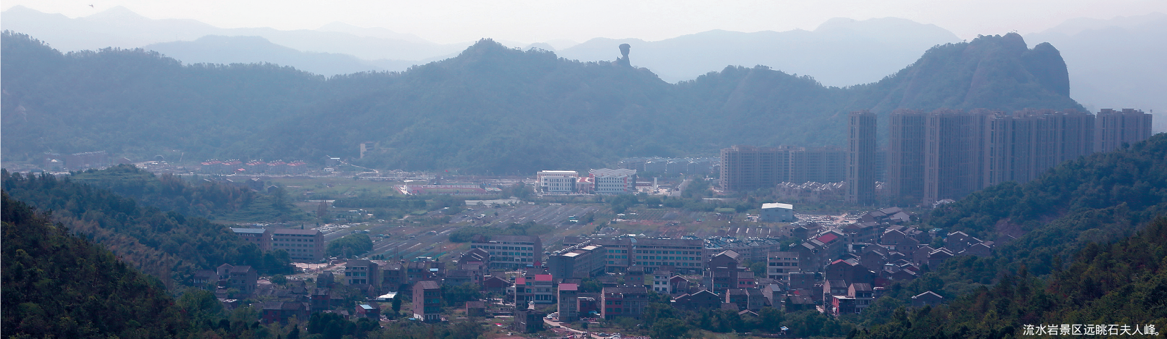
流水岩景区远眺石夫人峰。