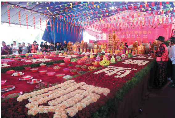
萧山林氏圆谱祭祖仪式。