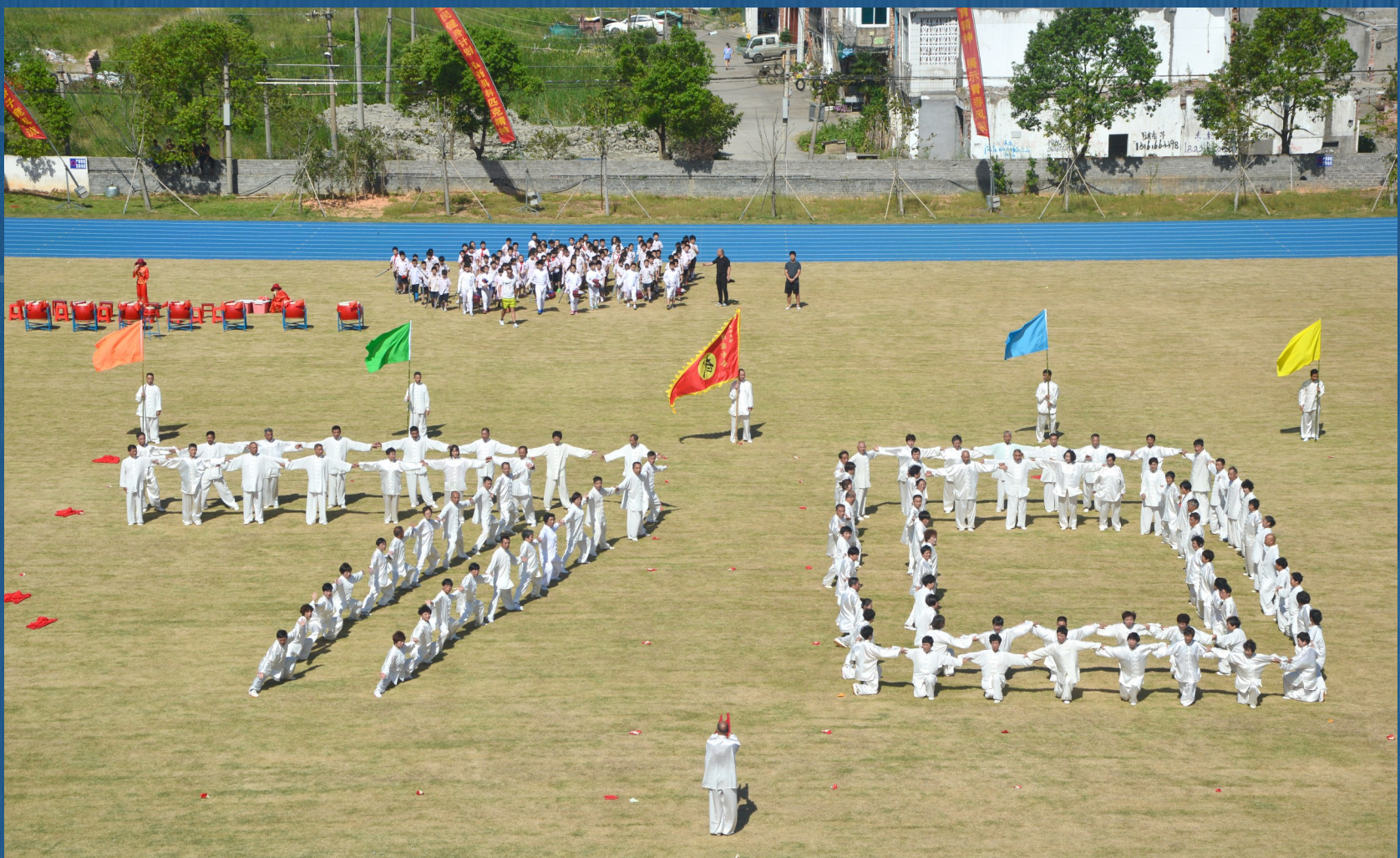
演员们排成“70”的字样，向新中国成立70周年献礼。