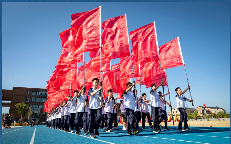
彩旗方队队员入场。