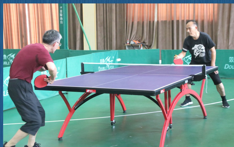
乒乓球比赛。