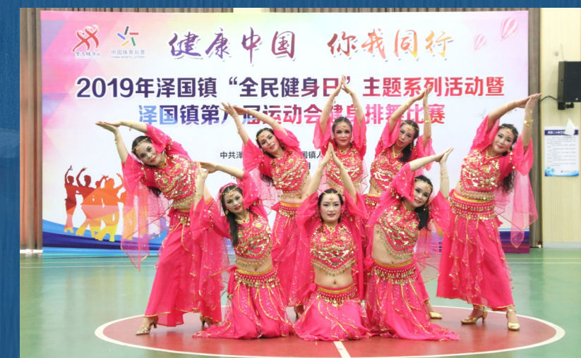
排舞比赛。