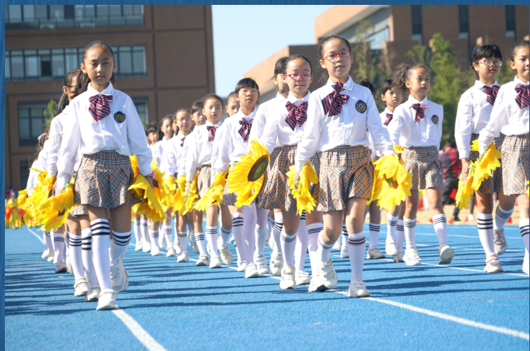
各学校代表队队员入场。