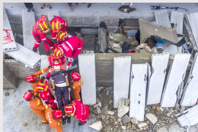
红豹救援队进入事故现场全场搜索，破车救人。