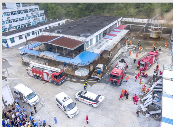
消防、公安、应急管理、卫健等相关部门迅速到达，展开灭火救援。