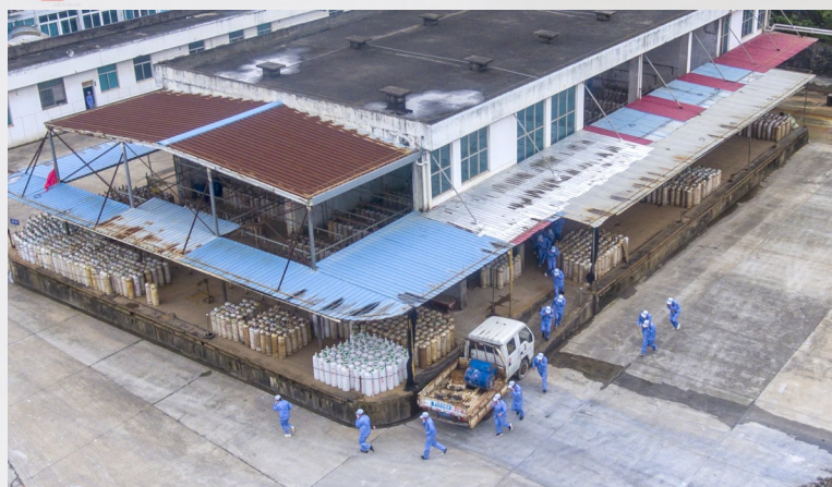
报警器报警，公司启动现场处置方案，并组织人员疏散。