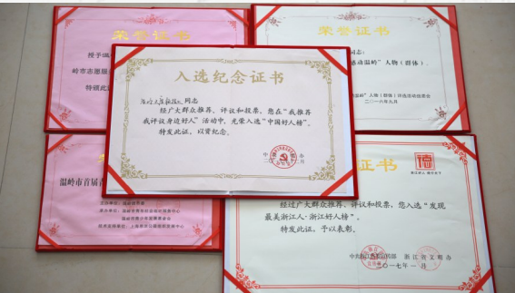
天鹰救援队荣获的证书（部分）。