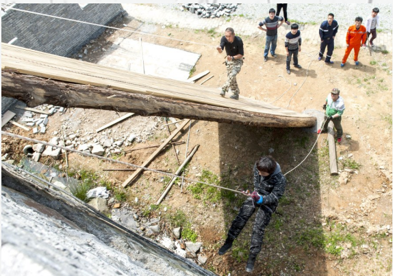
天鹰救援队开展高楼救援演练。