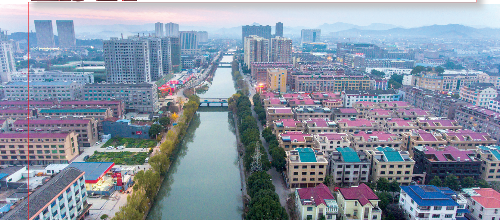
实力泽国。