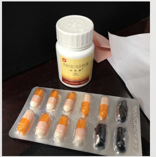
陈奔桌上放着两种肠胃药。

台州市生态环境局温岭分局副局长陶海燕说，陈奔自参加工作以来，始终以共产党员的标准严格要求自己，恪尽职守，敢于亮剑，在一线环境监察岗位上取得了优秀成绩。2015年至2017年，连续3年被局里评为年度工作先进个人。在陈奔的带领下，大溪环境监察中队成绩显著，多次被评为市局