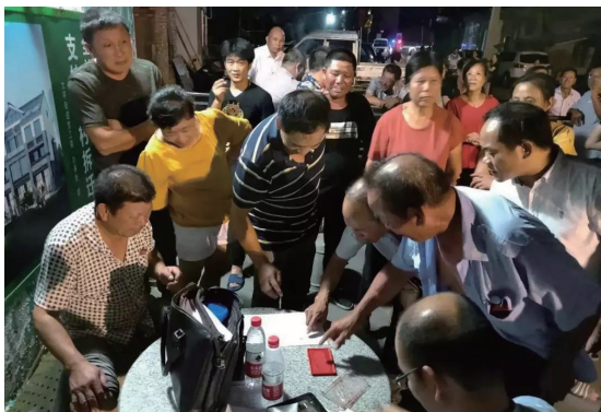
岙底胡城中村拆建指挥部工作人员正在解决邻里间纠纷等问题。