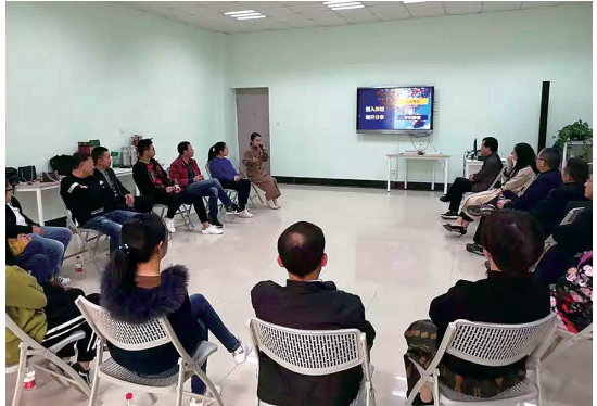
太平街道开展 青蓝计划 师徒结对。