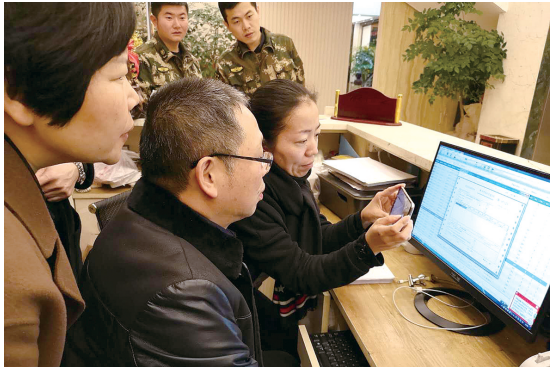
街道纪工委开展突击纪律检查。