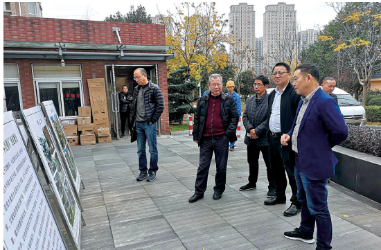
岙底胡村顺利通过房屋腾空验收。

干好干坏一个样 现象，彻底激发干部队伍活力。街道负责人表示，在今后工作中将加强责任捆绑考核和结果运用，把思想统一到想干事、敢干事、能干事、干成事上来，促进工作大提高、事业大发展。