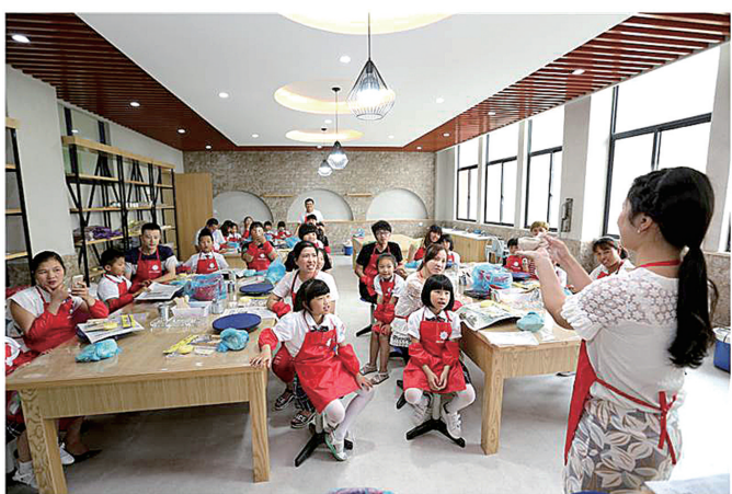
太平小学东部校区的陶泥课程。