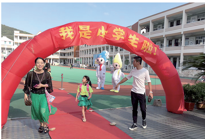
松门小学的入学课程。