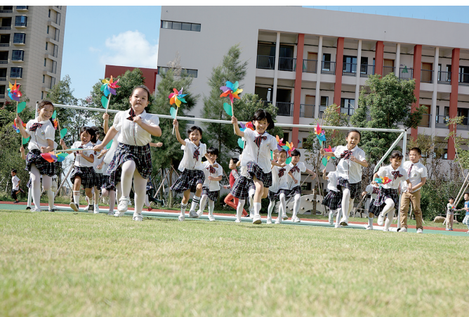
太平小学东部校区举办的风车文化节。