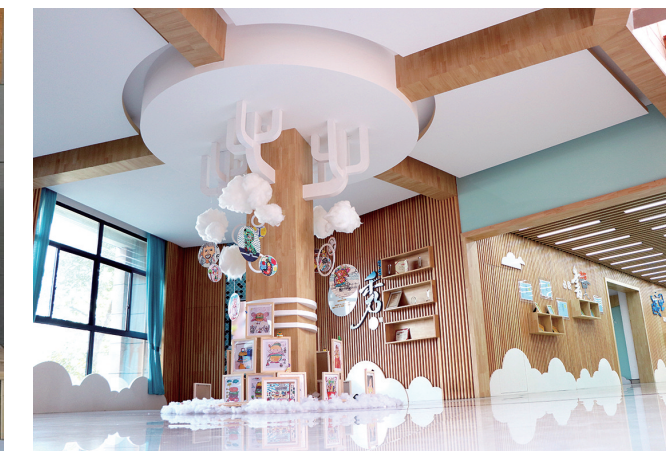
九龙学校小学部校园。