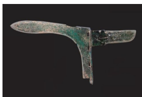
国家博物馆馆藏战国戈