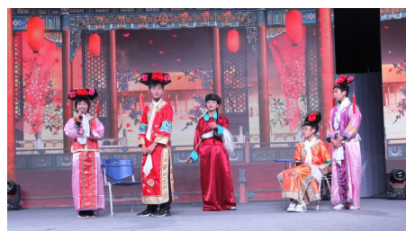
八(1)班男同学演绎的小品《甄嬛后传》。