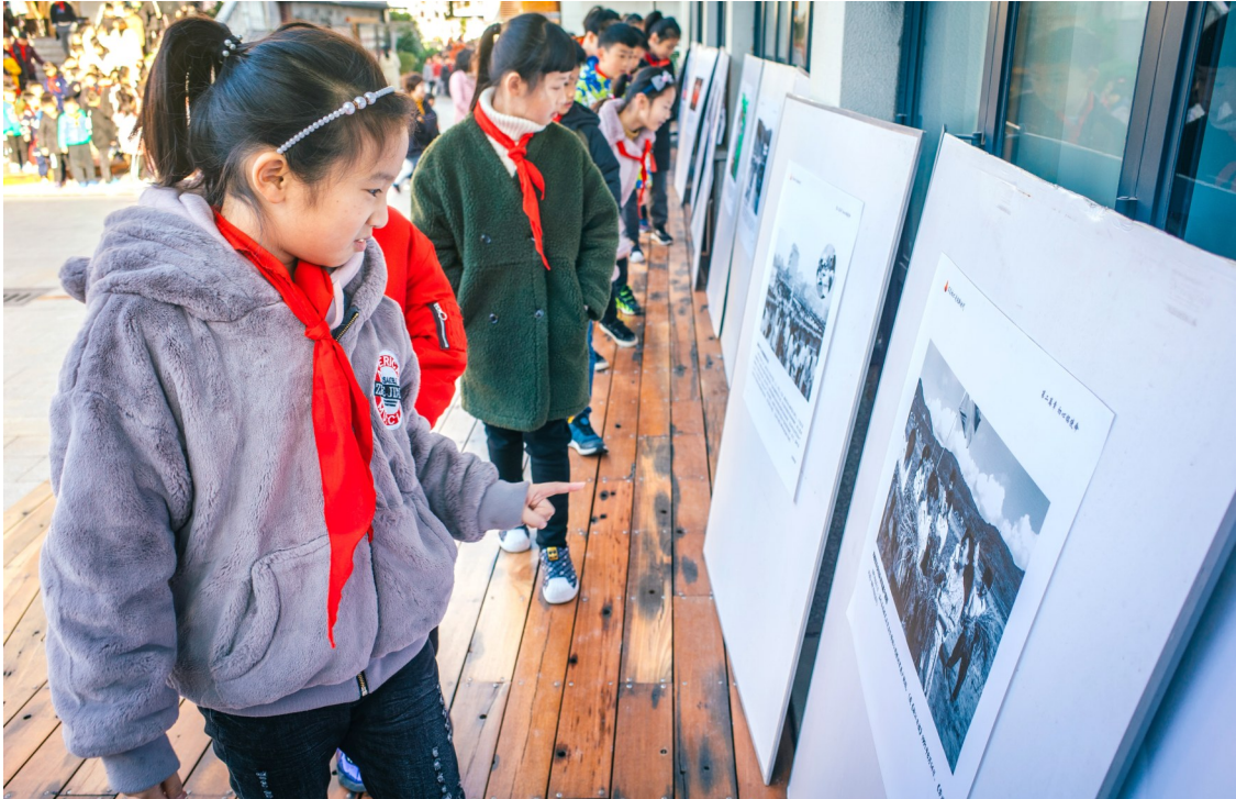
图为方城小学的学生在欣赏摄影作品。