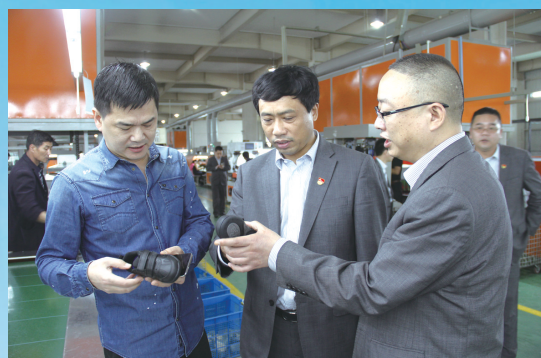
温岭农村商业银行开展大走访、大调研、大服务活动。