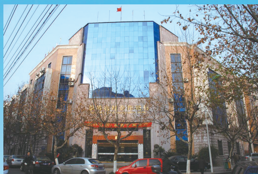
位于太平街道钟楼路2号的原温岭农村合作银行总行大楼。