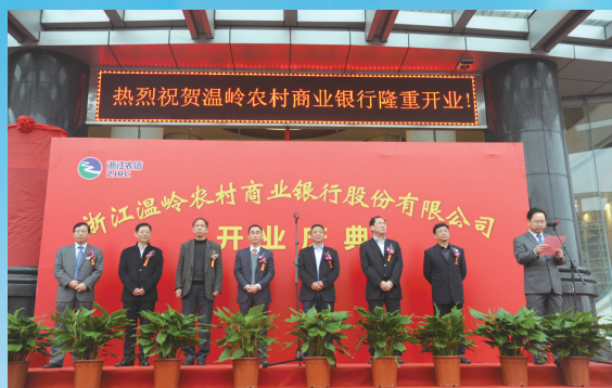
2015年12月，改制后的温岭农村商业银行正式开业。