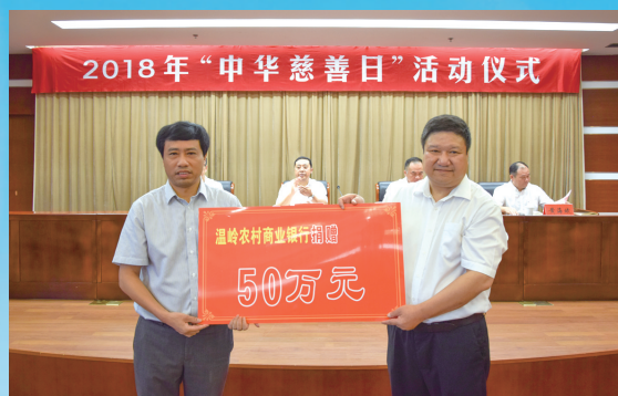
温岭农村商业银行不忘初心，积极履行社会责任。