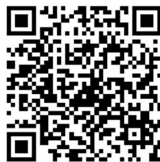
扫码看视频 本报记者 王迪青制作

突发胸部疼痛时，有可能发生的致命性疾病主要有急性心肌梗死、主动脉夹层动脉瘤破裂、急性心包填塞与肺栓塞等。出现症状后，应第一时间拨打120，有条件者应适当接受急救，等待专业医疗救助。