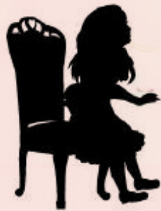
五大主题游戏之 纸牌骑士的尊严。