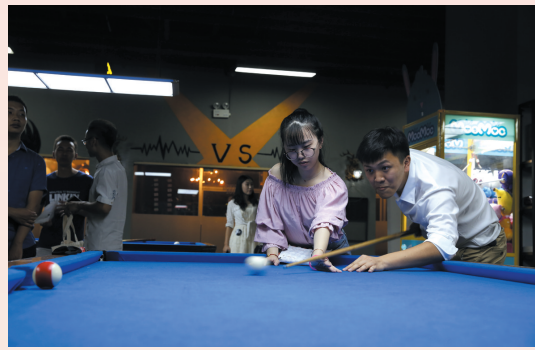
五大主题游戏之 消失的时钟兔。