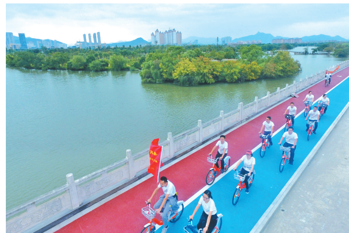
本报记者 王悦/文

夏女士最近在市区九龙汇公园边上开了一家小饭馆，小清新的装饰，点缀着灯笼珠帘，在夜幕中如同星光点点，与公园相映成趣，别有一番风味。