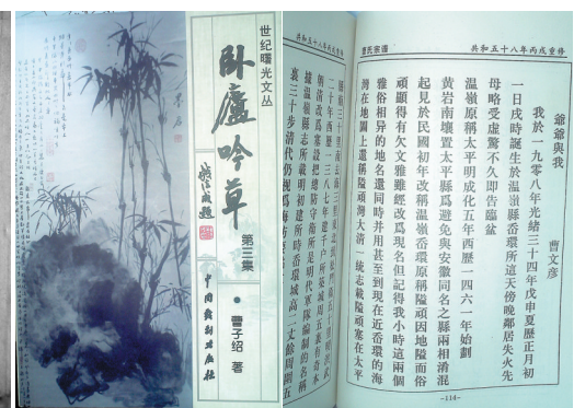
曹子绍诗集《卧庐吟草》三集。