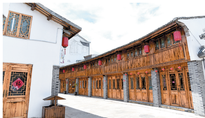
整治后的箬横老街。