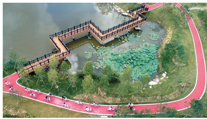
温岭江厦大港沿河景观提升。