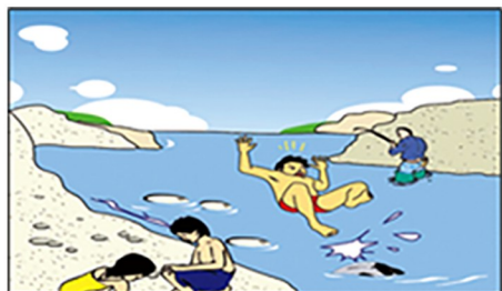
水底多为滑溜卵石，在水中行走，应注意免得滑倒。