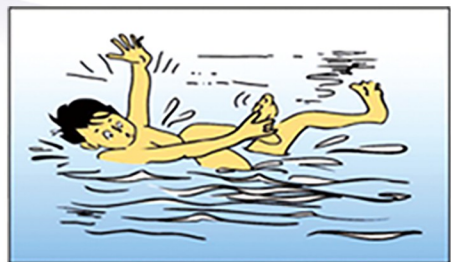
不可高估自己的游泳能力，才不会造成不幸。潜水时，应依自身能力为限，以免发生意外。