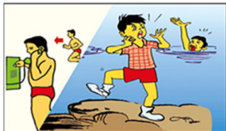
遇有人溺水时，应大声喊叫或打119向消防队请求协助。