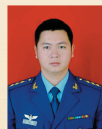
江 晓 箬横镇