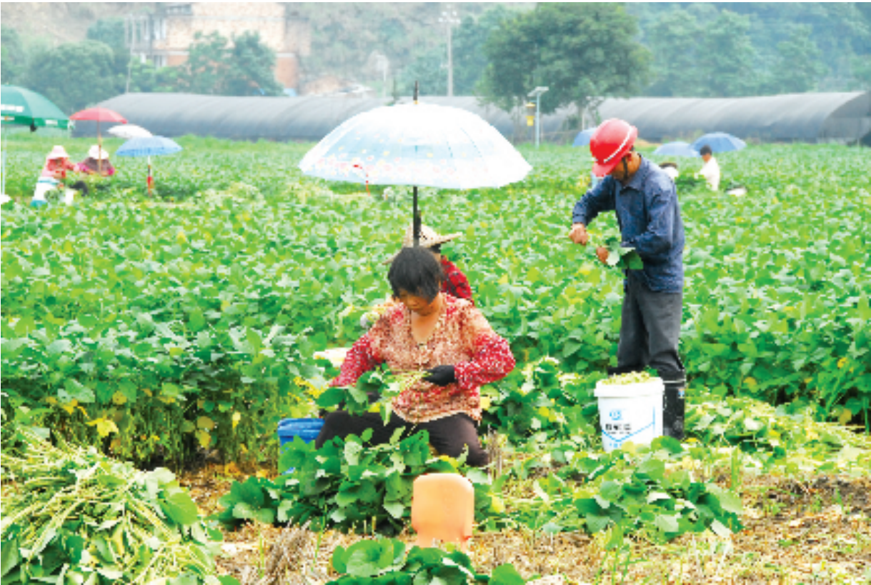
6月23日，天气难得放晴，石桥头镇毛豆种植大户加派人手抢收毛豆。石桥头镇是农业大镇，今年毛豆种植总量近6000亩，但是近年来，毛豆价格从最高的3.7元/斤跌至现在的1.1元/斤，市场价一跌再跌，让毛豆种植大户十分忧心。

本报讯（通讯员王淋华）6月24日，海上大雾弥漫，风力8级，市海洋与渔业局执法大队出海执行休渔期巡航执法检查任务时，巡航至210海区5小区，在钓浜内岛海域发现锚泊着一艘渔船，该船形迹可疑，隐藏在岛礁旁。 执法人员立即乘坐快艇前往登船检查，发现该船为一艘钢架泡沫型“三无”船舶，船上共有5名船员，从事流刺网捕捞作业，船艄右舷安装有一台起网机，右舷甲板上堆放着20张左右流刺网，驾驶台前甲板上的十多个泡沫箱里装有新鲜水潺，甲板和流刺网上散落着一些新鲜海鱼，捕捞作业痕迹明显。执法人员现场测量其流刺网网目尺寸为38毫米，小于国家规定的最小网目尺寸，违法事实清楚。 该船船主为福建霞浦人，现场未能向执法人员提供《渔业捕捞许可证》《渔业船舶检验证书》《船舶国籍证书》等渔业船舶相关有效证书，并对禁渔期未依法取得捕捞许可证擅自出海从事流刺网捕捞作业的事实供认不讳。 该船已被执法人员扣押，并当场没收非法捕捞的渔获物和违禁网具，船上5人均由礁山边防派出所武警官兵带走询问调查。接下来，根据《渔业法》的相关规定，这些涉嫌违法人员将被处罚，达到刑事要求的，将被移交相关部门追责。