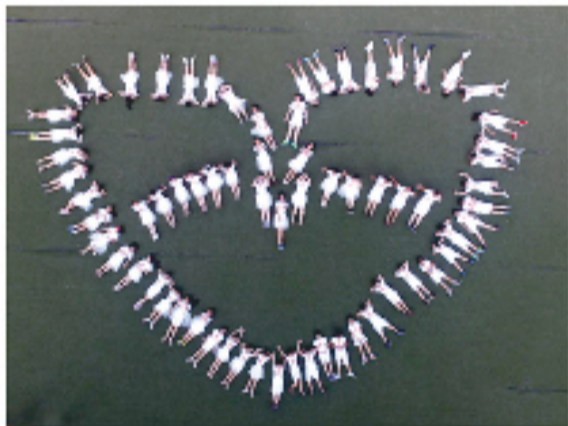
毕业学校:太平小学