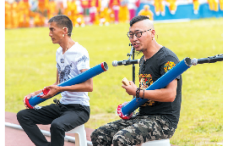
台州市级非遗扩展项目温岭道情。