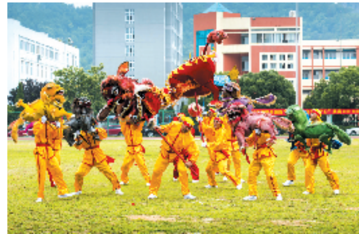
台州市级非遗项目舞九狮。