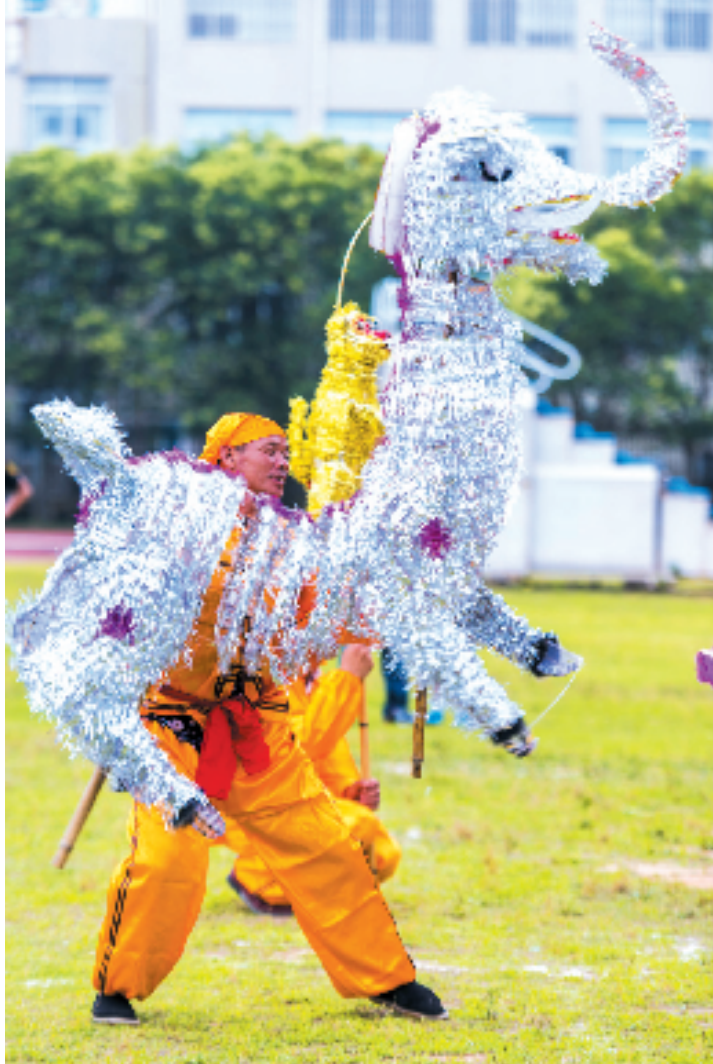
温岭市级非遗项目舞五兽。