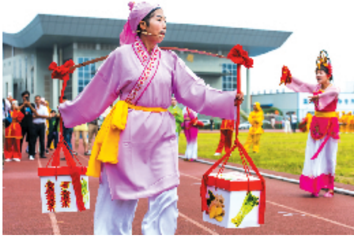
浙江省级非遗项目天皇花鼓。