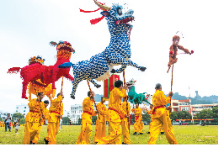
台州市级非遗项目六份五兽。