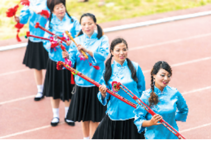
台州市级非遗项目酒尺。

当天下午3时开始在市职教城体育场内举行的庆祝“文化和自然遗产日”展演暨非遗项目考核汇报演出更为精彩，现场吸引了一大批摄影爱好者和市民。石塘镇红旗村的滚鱼、松门远景舞九狮、上王舞五兽、六份五兽、三星舞狮、城西吴岙舞龙，让观众见识了温岭各地丰富的闹元宵灯舞、舞龙舞狮文化。此外，道情、天皇花鼓、殿下莲花、酒尺、邱家岸锣鼓和渡首锣鼓等，风格各异，让人赏心悦目。此次集中展演的非遗项目中，传承历史最早的可追溯到700多年前。