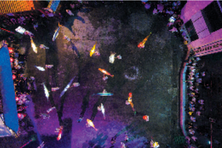
温岭市级非遗项目滚鱼。