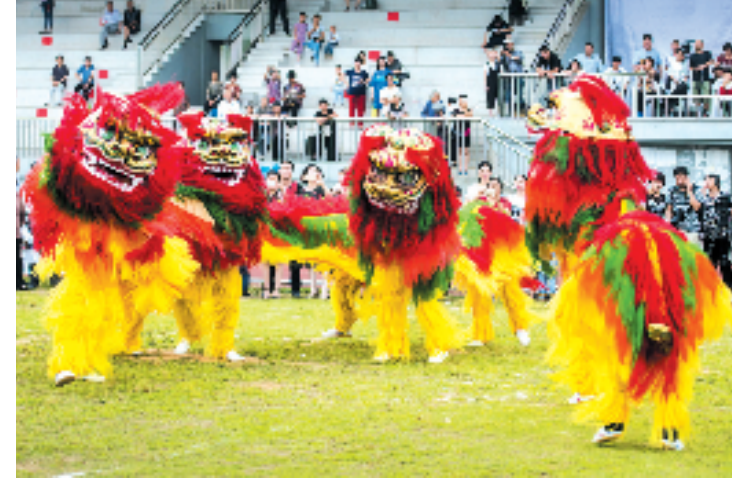
温岭市级非遗项目三星舞狮。