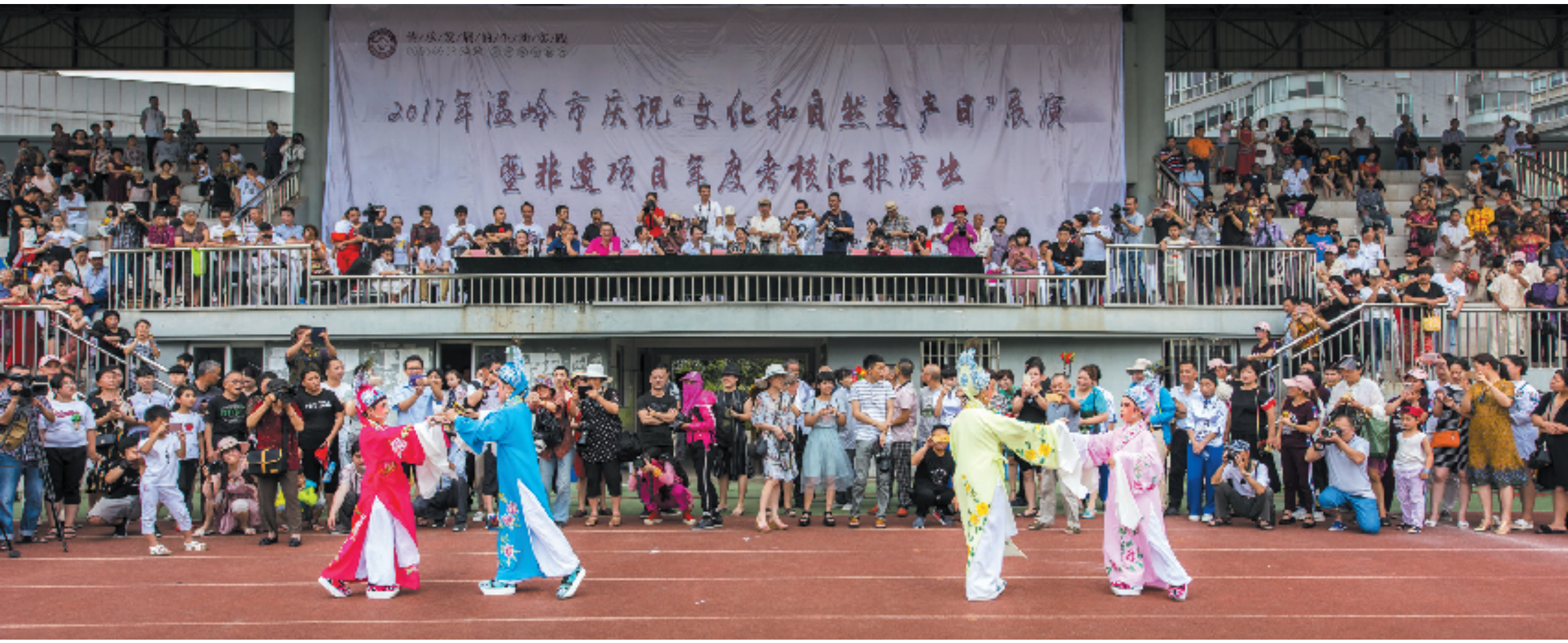
学生在表演非遗项目时，被“长枪短炮”聚焦。