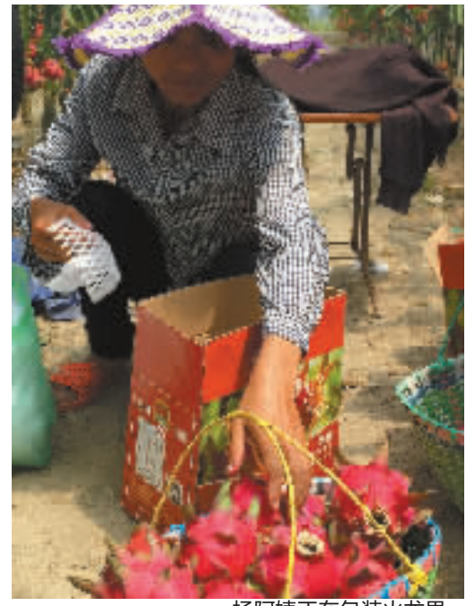
杨阿姨正在包装火龙果。

这个夏天骄阳似火，室外温度达40℃，大棚里温度更高。“如果能赚到钱，辛苦点倒没事。”昨天坐了一上午，没有盼来一位买家，老妈无奈地叹了一口气。看着父母黝黑的脸，日渐消瘦的身影，我真想扇自己一巴掌，因为当初是我提的建议。但在说服父母准备种植火龙果时，我并没有做过市场调查，导致现在面临很大的销售难题。有网友说，温岭人一见什么效益好，就如马蜂窝一般往上拥，这两年各地都在搞火龙果种植，这下可“杯具”了。确实，大面积种植后，销路解决不了，最终苦的是果农。“不想看着果子烂掉，还是便宜卖吧。”投入了那么多成本，花了那么多心血，最终换来的是老妈的一声叹息。他们白天要育苗、剪枝，晚上要进行人工授粉，经常要忙到凌晨三四点钟，每一个果实都蕴含了他们的汗水。父母舍不得请小工，起早贪黑地忙碌，结果好不容易盼来了果实成熟，如今销路却成了难题。新鲜火龙果摘下来，保存时间不长。而挂在枝头的的时间太长，容易出现裂果等问题。火龙果花青素含量很高，可以做火龙果汁，也可以在面点中添加，或是做成火龙果干，进行深加工，但目前温岭做这一块的很少，这一条路又行不通。经过这件事，我想对广大果农说，勇于尝试是好事，但千万别盲目，前期一定要做好调查。果子大批量上来后，必须要走批发路线，而我家没有种过水果，缺少这方面的人脉和资源。