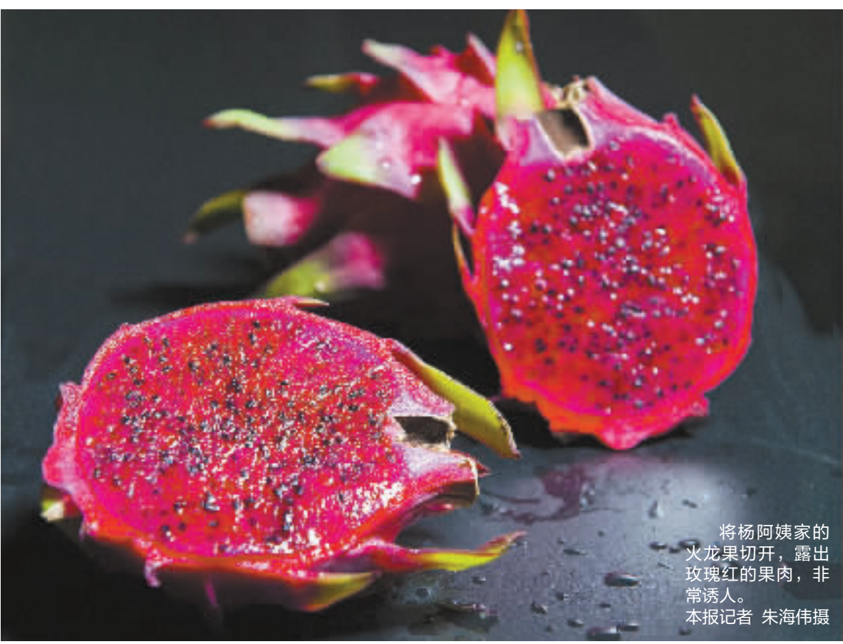
将杨阿姨家的火龙果切开，露出玫瑰红的果肉，非常诱人。

走进横镇田后村的米福红心火龙果园，一个个钢架大棚内，一株株火龙果树都有1米多高了，有些甚至高过了记者162厘米的身高。绿色的枝条看上去有些像仙人掌，上面挂着一个个红心火龙果，长势很好。杨阿姨是果园的主人，火龙果可以丰收了，但她高兴不起来，因为火龙果的销量成了问题。