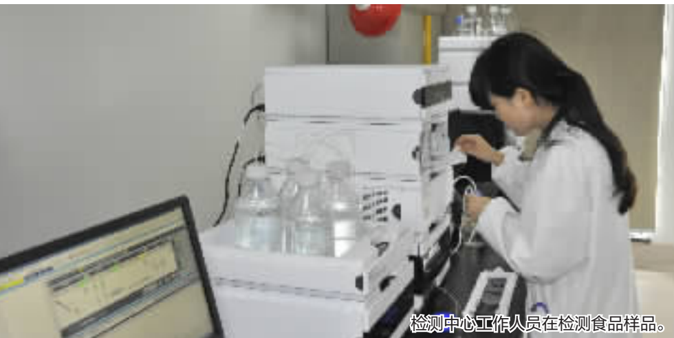
检测中心工作人员在检测食品样品。

这只是市市场监督管理局保障食品安全的一个缩影。投资4500万元建设市食品药品检验检测中心、各农贸市场设立快速检测室,将8家农贸市场的检测室免费对外开放,配备食品安全检测车进行巡回抽检……市市场监督管理局着力打造“一体两翼”食品安全检测体系,为食品上了一把“安全锁”。上半年,该局共定性、定量检测各类食品及相关产品50496批次,不合格305批次,总体合格率99.40%。其中定量抽检764批次,不合格21批次,合格率97.25%。