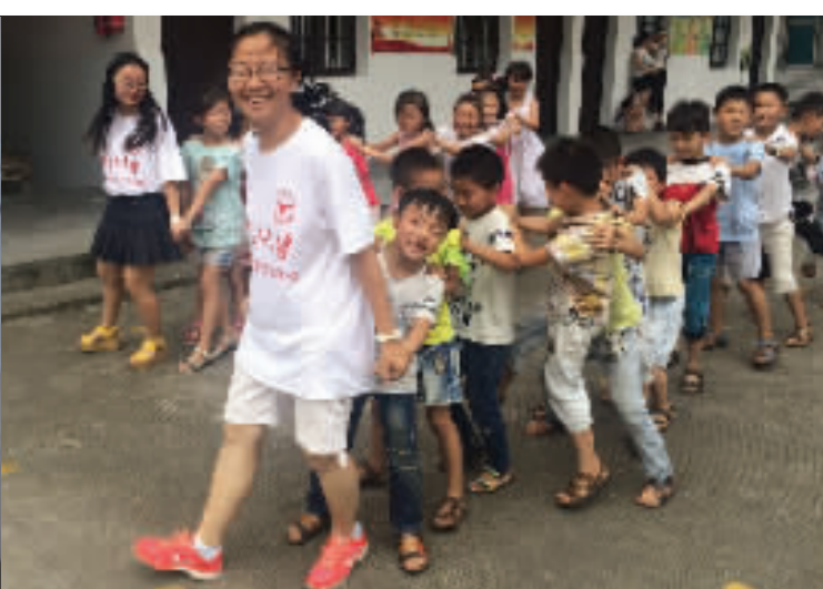
浙江大学三农协会学生和“小候鸟”们一起做游戏。