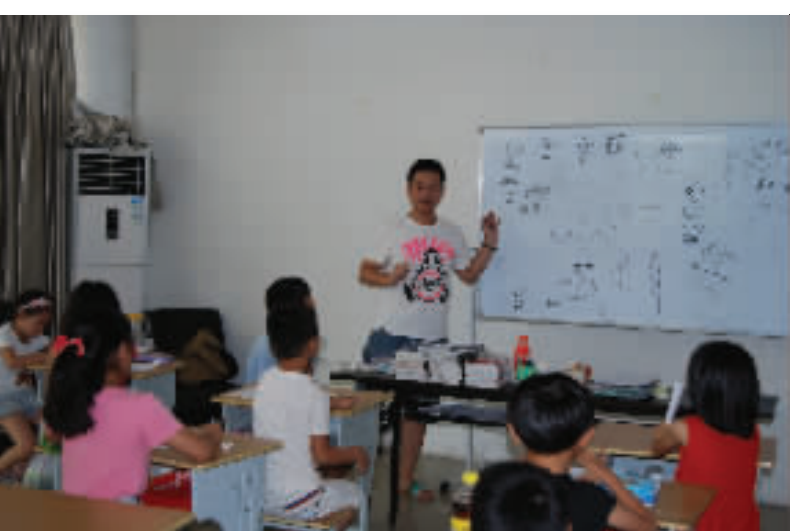
台州职业技术学院的大学生为“小候鸟”们上课。

在危房拆除现场，工作人员忙着拉警戒线、疏散附近居民，为防止拆除过程中对居民的生命和财产造成伤害，挖掘机在房屋的右侧先将存在安全隐患的房屋进行拆除，再慢慢向左边移动，虽进程不快，但确保了周边居民的安全。“这样的危房，一旦遇到台风这样的自然灾害，很可能发生意外，因此，尽快拆除并转移群众，是保证生命财产安全的一种方法。”该镇相关负责人表示，下阶段，还将对辖区内的危房进行全面排查，一旦发现安全隐患，立即予以拆除。