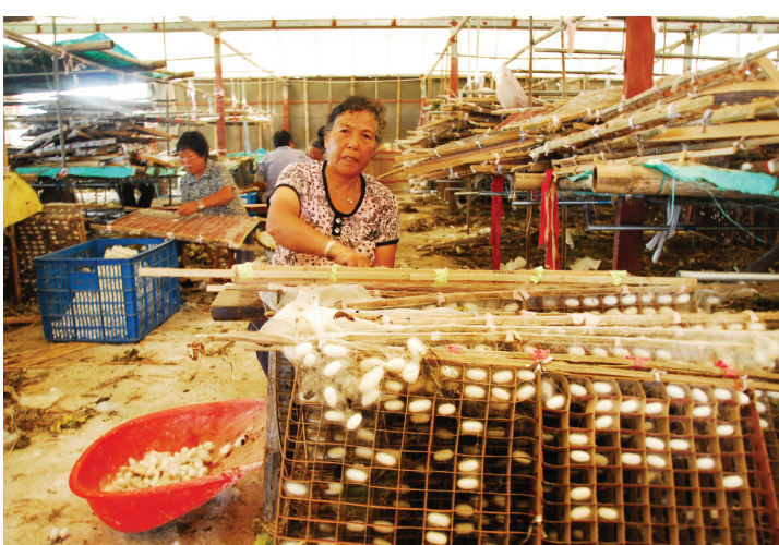
工人忙着收获蚕茧。

本报讯（记者赵碧莹 通讯员金盈盈文/图）这已经是郭标送今年第三批蚕宝宝了。灰黑色的幼蚕密密地卧在被切得细细的绿色桑叶上，每天都能吃掉上千斤桑叶。