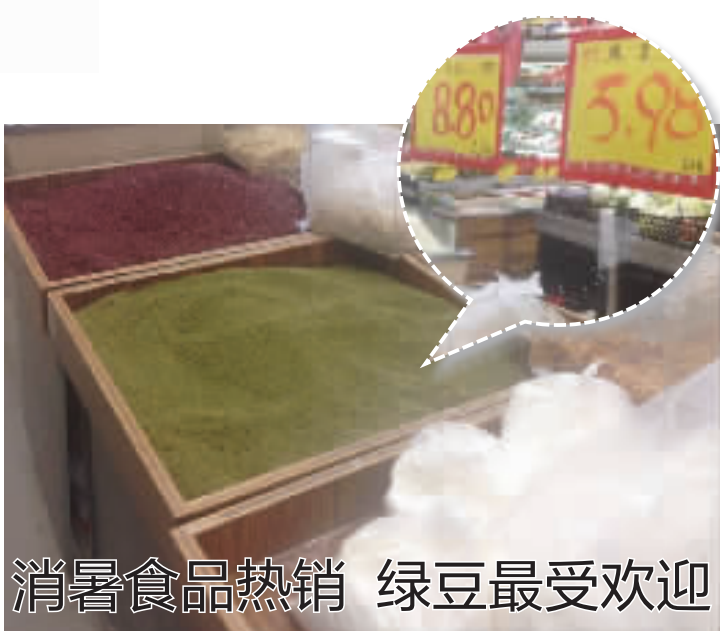
消暑食品热销 绿豆最受欢迎

“这对于一些能耗高、附加值比较低的中小塑料制品企业来说，将会是一个非常严峻的挑战。”业内人士认为，如今环保已经成了塑料行业的热词，今年元旦开始实施的新环保法，就间接倒逼着塑料制品企业调整方向。再加上温岭出口塑料制品的生产工艺和产品结构十分简单，生产成本构成也极为透明，“同质化”现象明显，使原本不高的利润仍在不断下降，这或许都会让温岭的塑料制品行业面临“洗牌”。