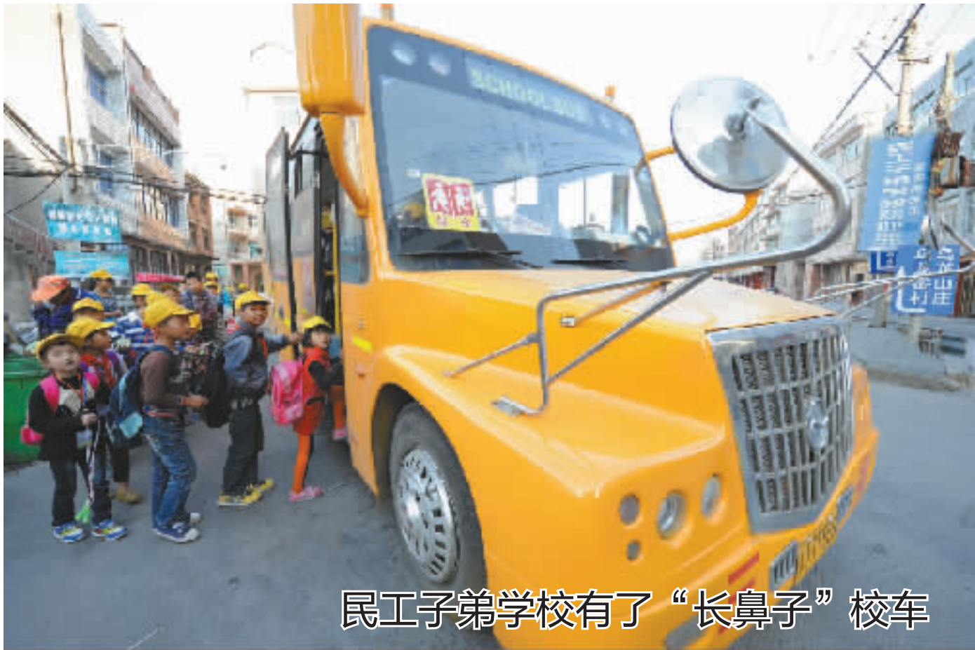
民工子弟学校有了“长鼻子”校车

昨天下午，城东民工子弟学校的“长鼻子”校车正在接送学生。该校共有1200多名学生需要接送，最近，学校投资50多万元，购置了两辆“长鼻子”校车，使校车的数量增加到了6辆，每辆校车都安排老师跟车，确保学生安全。